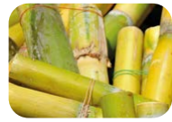
Materias primas 100 % sostenibles de caña de azúcar

Los bioproductos LaboPlast® Bio se fabrican exclusivamente a partir de materias primas sostenibles. Como propiedad adicional, los bioproductos SteriPlast® también se someten a una esterilización gamma. Bio-PE es 100 % reciclable y se fabrica sin materias primas fósiles. Gracias a esto, se reducen tanto la emisión de CO 2 como el efecto invernadero. La gama completa LaboPlast Bio también está certificada ACT por My Green Lab.