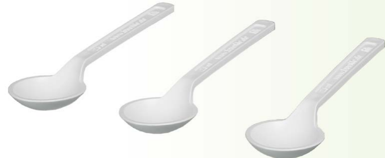
Ilustración: Muestra de una etiqueta ACT para las cucharas desechables de PE bio de Bürkle

Para más información sobre la etiqueta ACT, visite act.mygreenlab.org